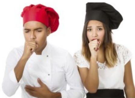
Estornudos y tos persistentes