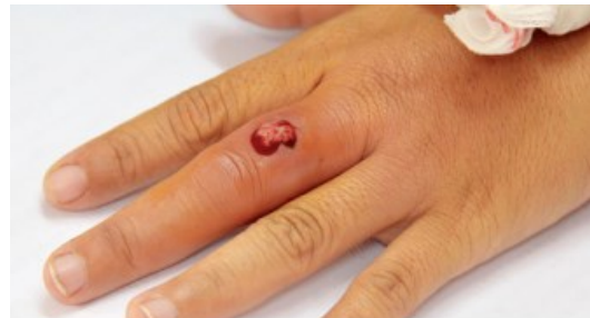
Heridas abiertas o infectadas