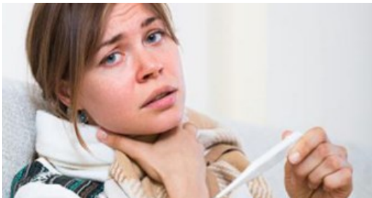
Fiebre con dolor de garganta